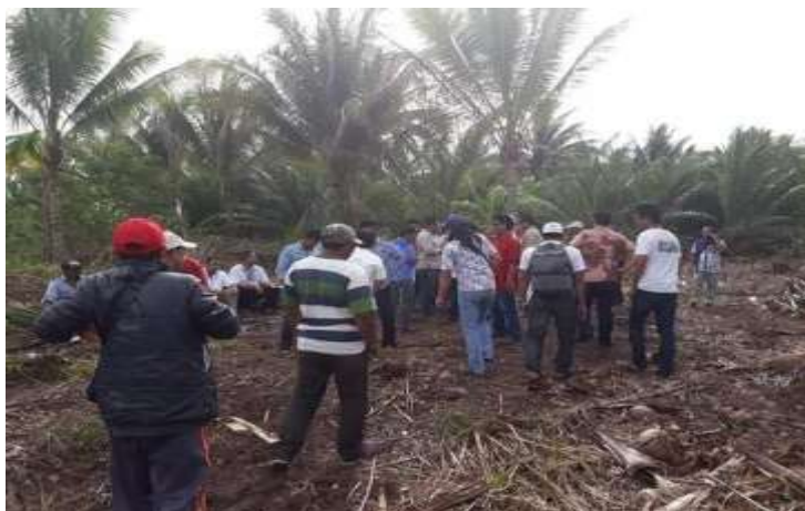
Gambar 1. Konflik Agraria

adanya kepentingan oleh pihak korporasi untuk melakukan investasi di Kota Bontang dengan proses pelaksanaan pembebasan lahan.