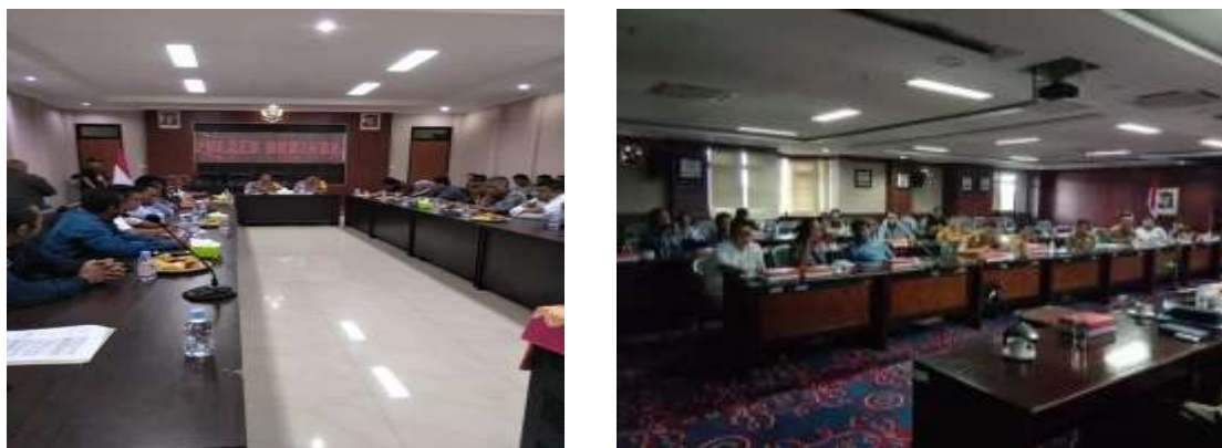
Gambar 4 : Proses mediasi

Sehingga sehubungan dengan uraian diatas maka penyelesaian konflik secara non-litigasi tidak menghasilkan suatu perjanjian untuk mengakhiri konflik, akan tetapi kelompok masyarakat Bontang (Kelompok Tambak Damai Indah) tetap dengan pendiriannya untuk mendapatkan ganti rugi agraria tersebut yang telah digunakan oleh pihak korporasi untuk membangun sebuah pabrik turunan CPO dan CPOK. Perseteruan ini pada akhirnya Pemerintah Kota Bontang dan pihak Korporasi mengambil kebijakan upaya penyelesaian konflik ke jalur hukum kepada kelompok masyarakat Bontang untuk menaikkan tuntutan ke pengadilan, akan tetapi kelompok masyarakat Bontang tidak melanjutkan penyelesaian konflik agraria ini ke pengadilan, dikarenakan tidak tercukupinya biaya untuk membuka perkara di pengadilan dengan jumlah yang cukup besar meskipun kelompok masyarakat Bontang memiliki bukti kepemilikan legalitas asli.